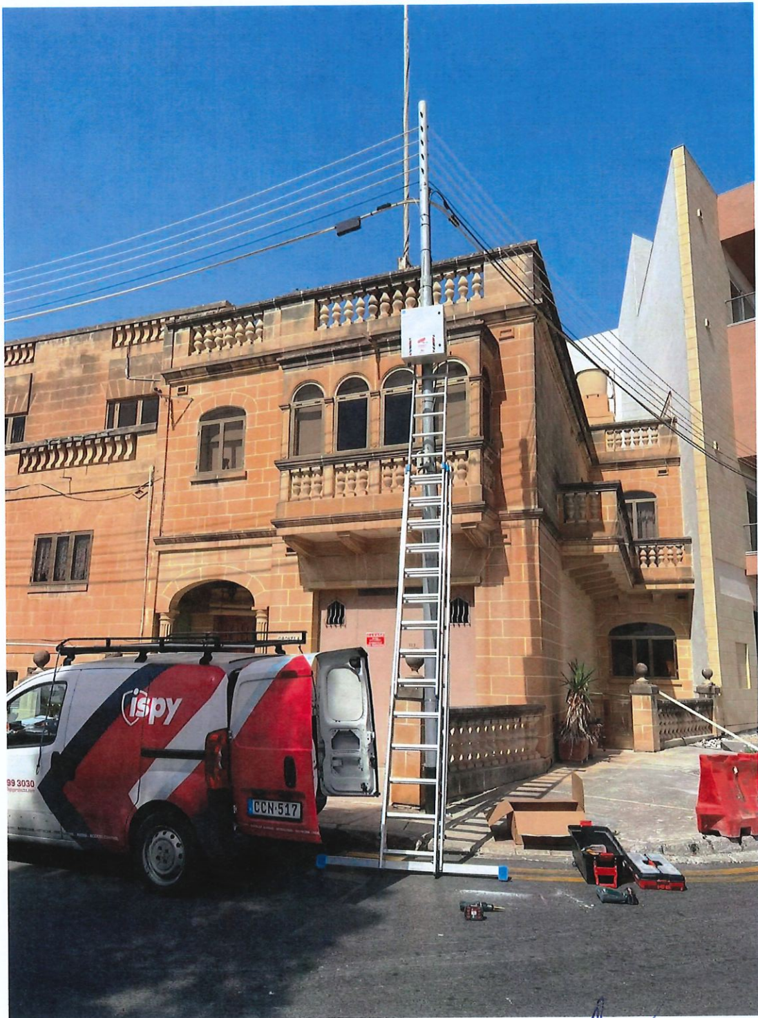
Triq Kurunell Mass