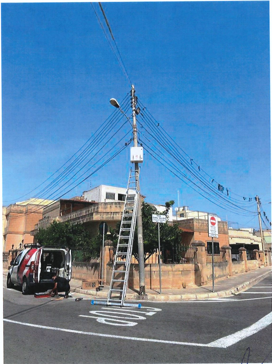
Triq Cikka Saliba