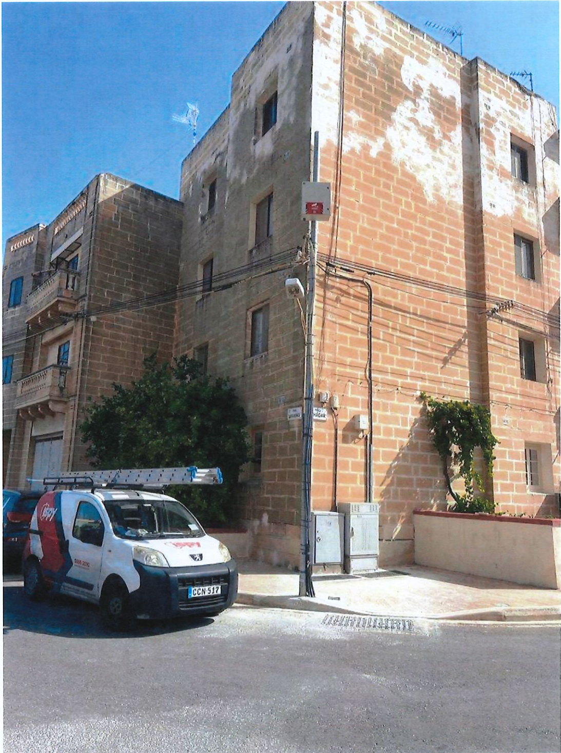
Triq Santa Monika