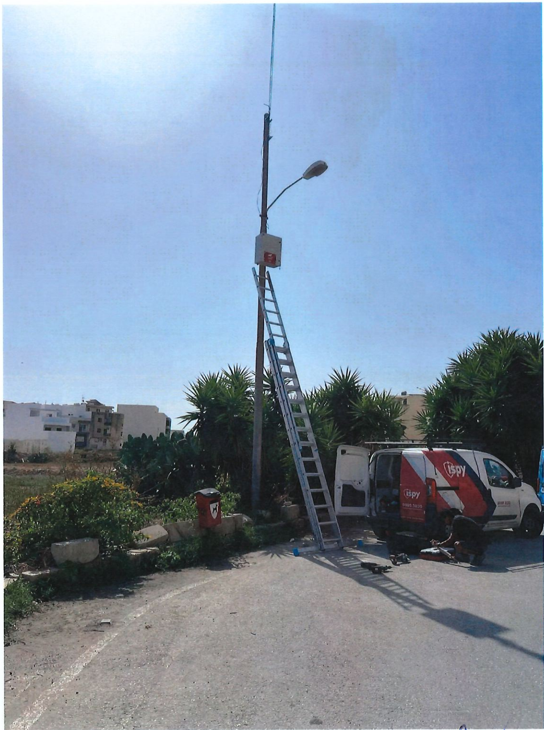
Triq ta' Sardinja